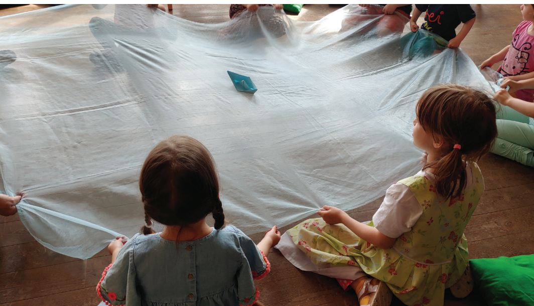
Die Kinder erlebten die biblische Geschichte von der „Sturmstillung“